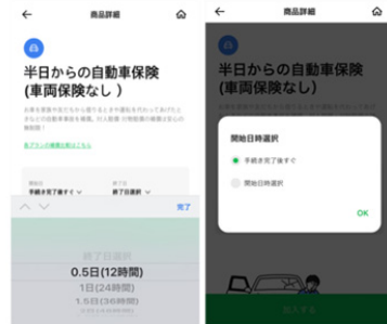
2.開始日時と時間を選択